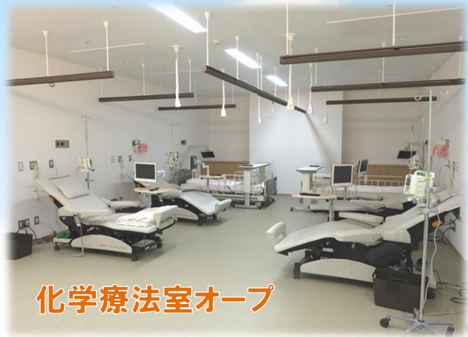
化学療法室オープン