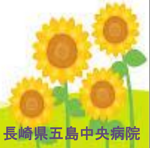
長崎県五島中央病院