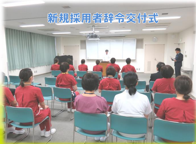
新規採用者辞令交付式