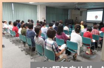
7/24認知症サポーター講座にて